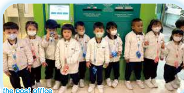
We took photos at the post office 我們在郵局拍照留念