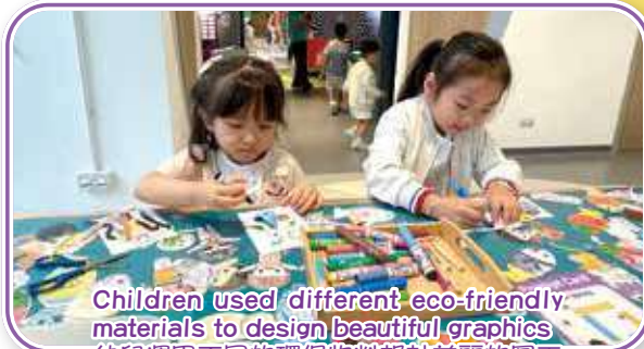
Children used different eco-friendly materials to design beautiful graphics 幼兒運用不同的環保物料設計美麗的圖工