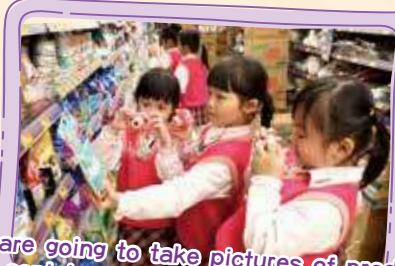
We are going to take pictures of products that contain powder. Click! Click! 我們要把包含粉的產品拍下來。咔嚓！咔嚓！