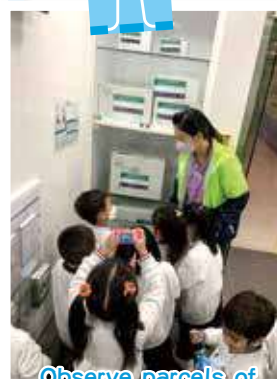
Observe parcels of different sizes 觀察不同大小的郵包