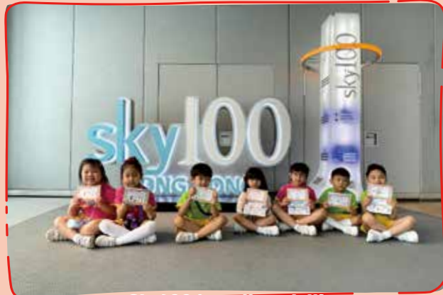
Sky 100 is really so tall! 天際100真的很高哦!!