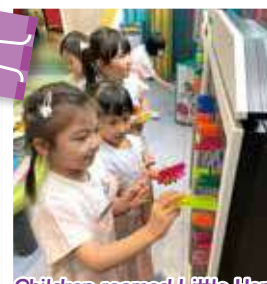
Children roamed Little Hong Kong together and used acrylic glue sticks to create beautiful and luminous patterns 幼兒共同漫遊小香港，利用亞加力膠棒，打造出美麗兼發光的圖案

幼兒能運用特別工具和材料進行探索及實驗，如「水源號」設有多個機關，他們可以嘗試運用水壩堵截或改變水流，觀察小船的流動。他們也能觀察各式各樣的標本，認識大自然的奧妙。同時亦讓幼兒學習尊重與愛護環境。