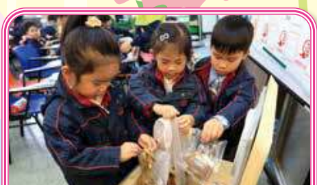
We can put food waste that cannot be eaten into the food waste machine. 我們能把不能進食的廚餘放入廚餘機