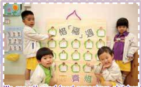
We are all good food-conscious children! 我們都是惜食的好孩子！