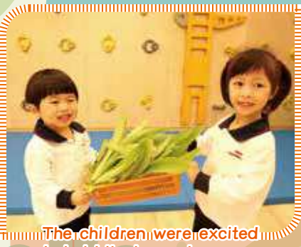
The children were excited to hold the harvest 幼兒都興奮地拿著收成品