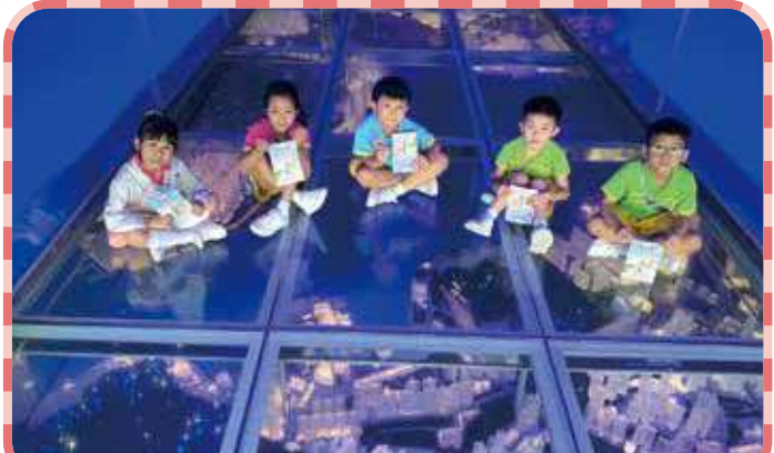
There are many HK buildings model under the glass! 玻璃底下有很多迷你大廈呢!