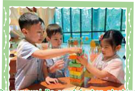
So nervous! Be careful when stacking layers as they can easily collapse! 好緊張啊！層層疊好容易會倒塌，要好小心！