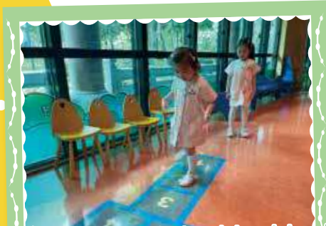
Let's play hopscotch. Jump! Jump! Jump! 跳飛機。跳！跳！跳！