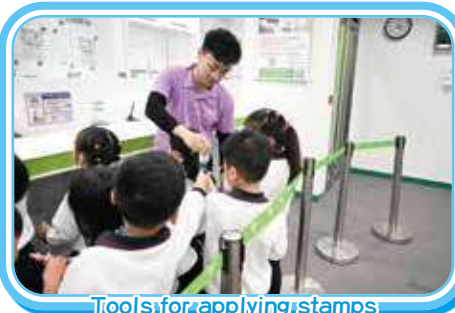
Tools for applying stamps 貼郵票的工具