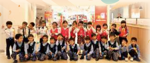
We are going to visit Wellcome and we are excited! 我們準備去惠康參觀了，很興奮呢！