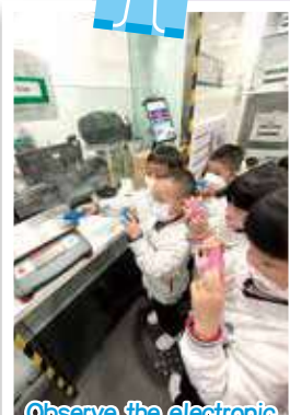
Observe the electronic scale to weigh the mail 觀察磅郵件的電子磅