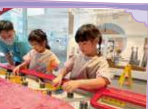
Children try to use dams to block or change water flow, and then observe the movement of boats 幼兒嘗試運用水壩堵截或改變水流，然後觀察小船的流動