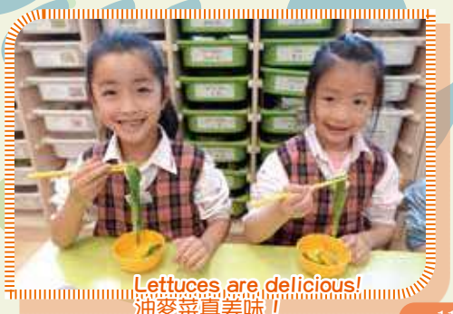
Lettuces are delicious! 油麥菜真美味!