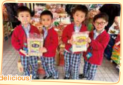
Rice can be used to make different foods, which are delicious! 米可以用來做成不同的食物，很美味哦！