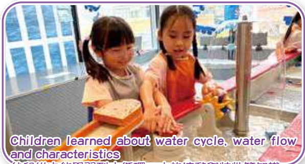
Children learned about water cycle, water flow and characteristics 幼兒從中能學習到水循環、水的流動與特性等知識