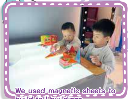
We used magnetic sheets to build tall buildings 我們用磁力片拼砌出高樓大廈