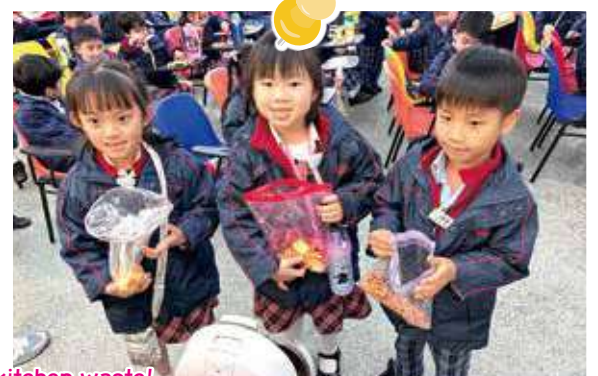
All we have is kitchen waste! 我們手上的都是廚餘呀！