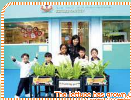
The lettuce has grown up. Amazing! It grows luxuriantly 太好了! 油麥菜長大了! 長得非常茂盛!