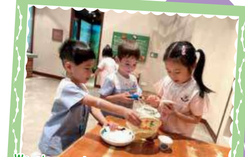
We also explored utensils from different traditions 我們也探索了不同傳統的器皿