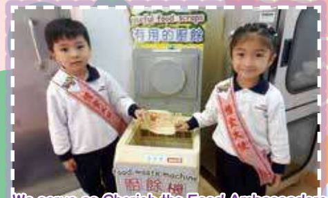
We serve as Cherish the Food Ambassadors and promote the message of Cherish Food together! 我們擔任惜福大使，一起宣揚惜食資訊！