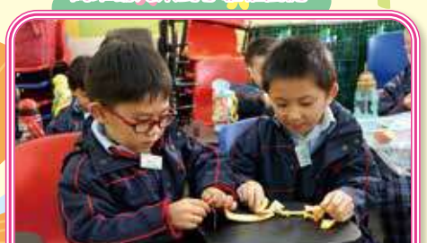
We have to tear the orange peel into pieces before putting it into the food waste machine. 我們要把橙皮撕成碎片才能放入廚餘機