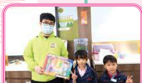
Thank you to the staff for organising interesting lectures for young children! 感謝惜福廚房的職員哥哥為幼兒分享有趣的講座！