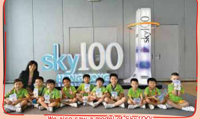
We also saw a model of Sky 100! 我們還看到天際100的模型哦!