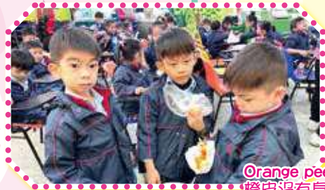
Orange peel has no smell! 橙皮沒有臭臭的味道喔！