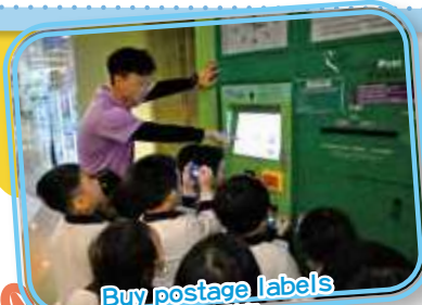
Buy postage labels 購買郵資標籤