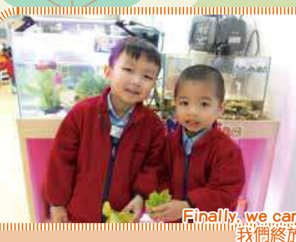
Finally, we can harvest our romaine lettuce! 我們終於能夠收成羅馬生菜了!