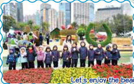
Let's enjoy the beautiful flowers together! 大家一同欣賞美麗的花朵!