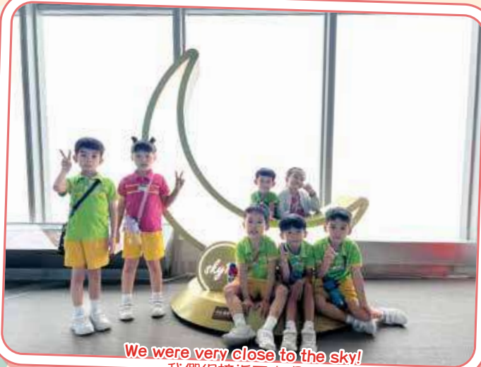
We were very close to the sky! 我們很接近天空呢!!