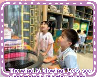
The wind is blowing! Let's see what material floats upward 大風吹！看看甚麼物料向上飄