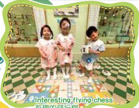
Interesting flying chess 有趣的飛行棋

幼兒到香港文化博物館內的兒童探知館中的「香江童玩」展覽參觀，幼兒能探索一些難得一見的古董玩具，也能試玩多種不同的玩具，令幼兒樂而忘返。