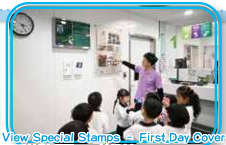
View Special Stamps - First Day Cover 觀看特別郵票——首日封