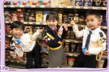
We see different types of powder in our daily life 我們日常生活中會看到有不同種類的粉