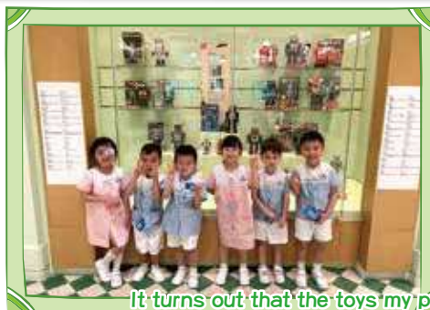
It turns out that the toys my parents had were like this 原來爸爸媽媽以前的玩具是這樣的