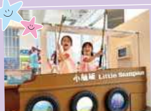
Children boarded the little sampan to listen the songs and fish to feel Hong Kong's fishing port 幼兒登上小舢舨，一邊聆聽歌謠，一邊釣魚，感受香港漁港情懷