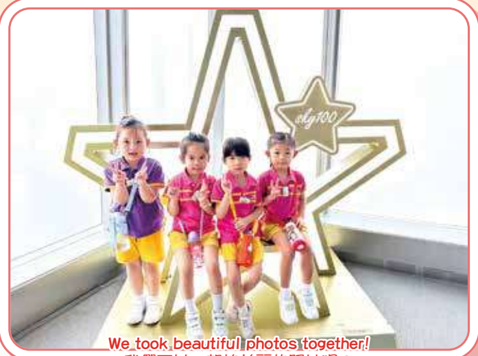
We took beautiful photos together! 我們可以一起拍美麗的照片呢!