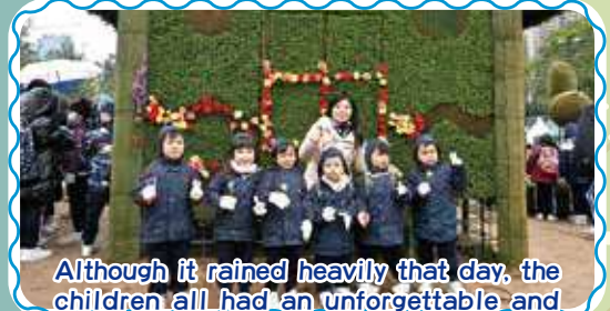
Although it rained heavily that day, the children all had an unforgettable and happy memory in Victoria Park! 雖然那天雨紛紛，幼兒們都在維園留下一個難忘又愉快的回憶呢!