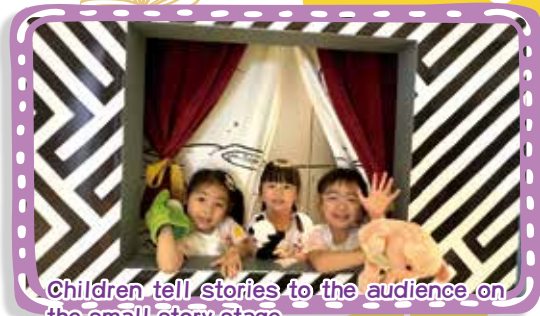
Children tell stories to the audience on the small story stage 幼兒在故事小舞台中，對着現場觀眾講故事