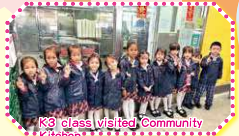
K3 class visited Community Kitchen 高班幼兒來到了惜福廚房