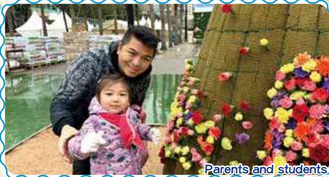
Parents and students alike enjoy flower arranging together! 家長和學生都一起享受插花的樂趣!