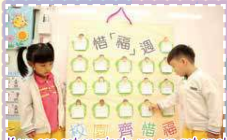
If we can eat sparingly, we can get small stamp rewards! 我們能夠惜食，便能夠獲得小印章獎勵呢！