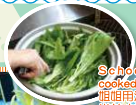
School's amah's cooked lettuces 姐姐用油麥菜烹調 出美味的料理